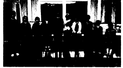
受賞者の皆さん（2017年）