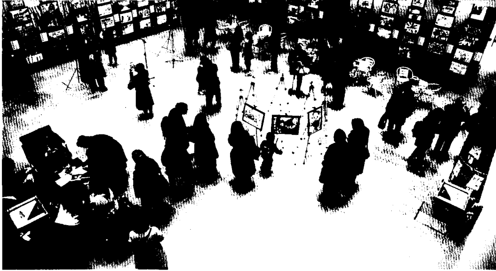
大使館アトリウムでの公開展覧会「オープン・デー」